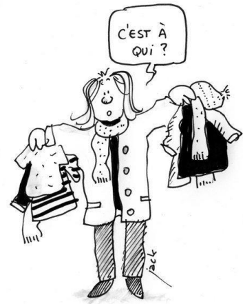
ramasseur de vêtements après la récré