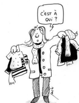
ramasseur de vêtements après la récré